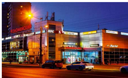
ТК «Коломенский» м. Коломенская Общая площадь – 3 200 кв. м.