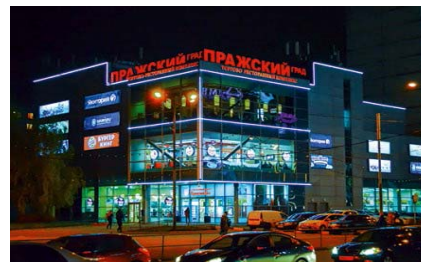
ТРК «Пражский Град» м. Пражская Общая площадь – 3 000 кв. м.