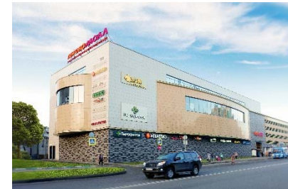
ТРК «ПЕРОВО МОЛЛ» м. Перово и Новогиреево Общая площадь – 13 500 кв. м.