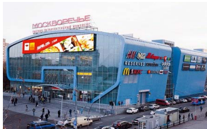
ТРК «Москворечье» м. Каширская Общая площадь – 30 000 кв. м