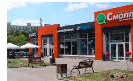
Сеть районных торговых центров «Смолл» 6 объектов Общая площадь – 5 200 кв. м.