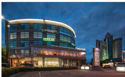
ТДК «Тульский» м. Тульская Общая площадь – 13 300 кв. м. Открыт в ноябре 2008 г.