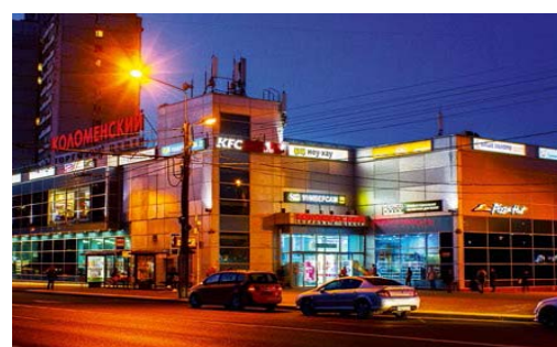
ТК «Коломенский» м. Коломенская Общая площадь – 3 200 кв.м. Открыт в мае 2006 г.