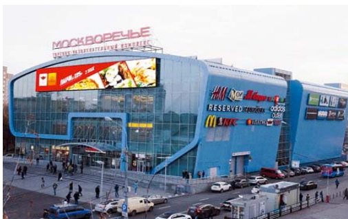
ТРК «Москворечье» м. Каширская Общая площадь – 30 000 кв. м. Открыт в марте 2014 г.