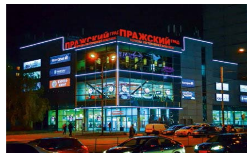
ТРК «Пражский Град» м. Пражская Общая площадь – 3 000 кв. м. Открыт в июне 2007 г.

В 2017 году в рамках Инвестиционной программы компания приобрела 4 новых объекта торговой недвижимости общей площадью 16,3 тыс. кв.м., которые в настоящий момент проходят редевелопмент и реновацию в соответствии с концепцией программы «РЕ».