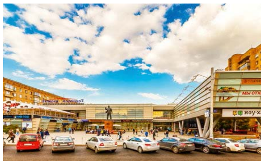
ТК «Галерея Аэропорт» м. Аэропорт Общая площадь – 12 000 кв. м. Открыт в мае 2003 г.